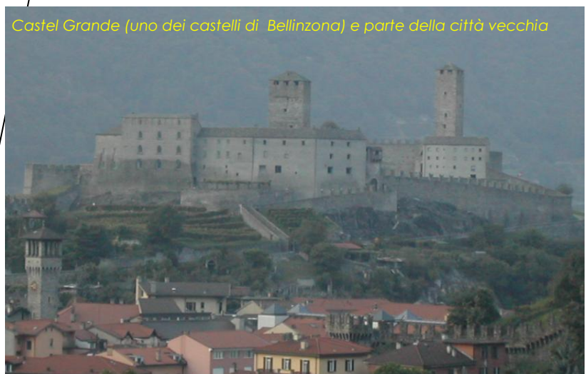
Castel Grande (uno dei castelli di Bellinzona) e parte della città vecchia

Bellinzona e Daro (abitanti: 14'870). dal 1610