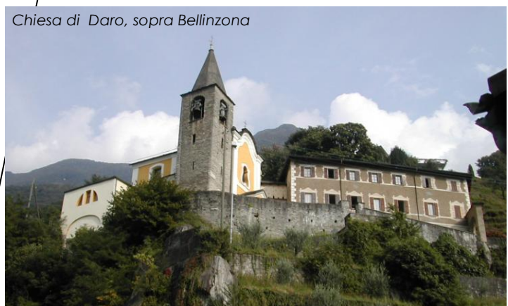
Chiesa di Daro, sopra Bellinzona

Valle di Blenio (origini, ca. 1530 d.c.)