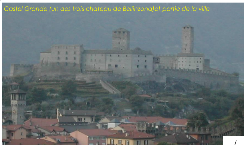
Bellinzona et Daro (population: 16'870)