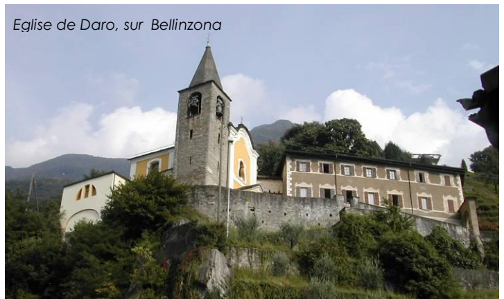
Vallée de Blenio